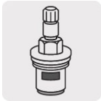
Cartucho cerámico 90° (CARCE-7)