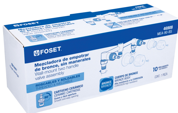
Conexiones roscables 1/2"-14 NPT