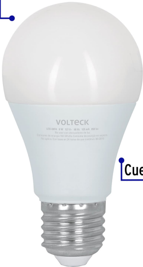
Pantalla de policarbonato