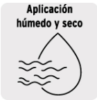
Aplicación húmedo y seco