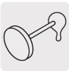
Presentación en lata incluye aplicador